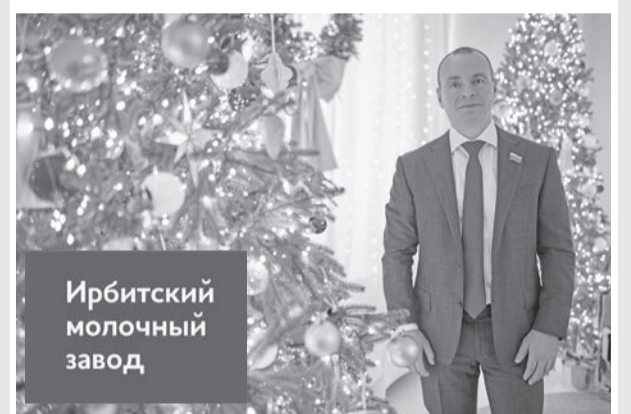
Ирбитский молочный завод

Дорогие друзья! От всей души поздравляю вас с наступающим Новым годом!