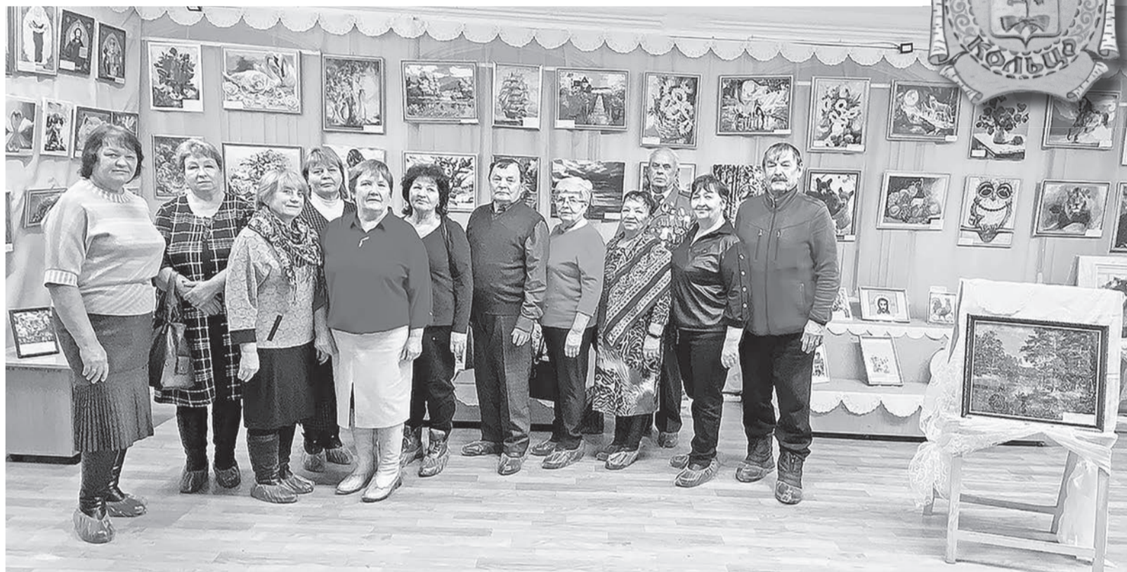
Ветераны МО МВД «Байкаловский» посетили выставку «Руками вышитое чудо-2023».

В этом году (уже культурно-исторический) маршрут «Берестяное кольцо» передан Байкаловскому краеведческому музею. Создано три новых маршрута: «Земля героев рождает», куда входит посещение музеев поисковых движений «Сварог» (Байкаловская СОШ), «Красная звезда» (Краснополянская СОШ) и «Альфа» (Пелевинская ООШ), музея МО МВД России «Байкаловский», районного краеведческого музея, центральной площади Байкалово, где можно было познако-